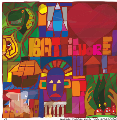
gioia piena alla tua presenza